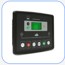
DSE 334 Netzüberwachung