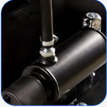
Heizsystem des Motors