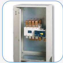
Motorbetriebene Schalttafel Socomec