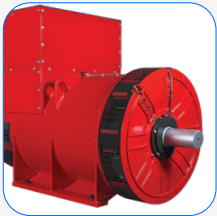
MECC ALTE Generator