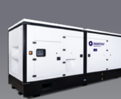
DGBS 880 ST