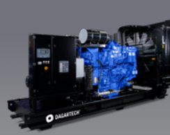
DGB 880 ST