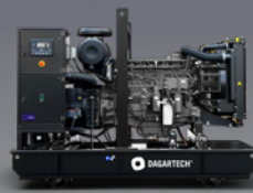
DGP 90 ME