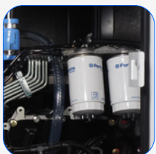
Externe Tanks ROTH DUO SYSTEM