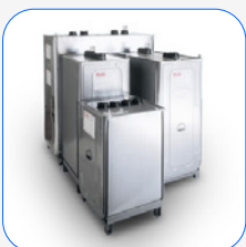
Externe ROTH-Tanks DUO SYSTEM