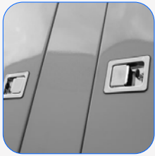
Haube komplett aus Edelstahl (304)

PERKINS 1104A-44TG2 | MECCALTE ECP32 2L4 C