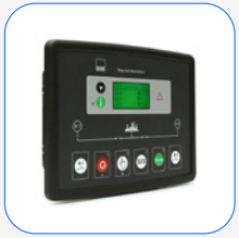
DSE 334 Netzüberwachung