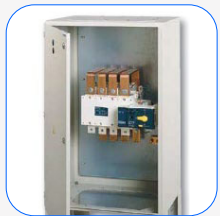
Motorbetriebene Schalttafel Socomec