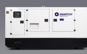
DGPS 90 ME