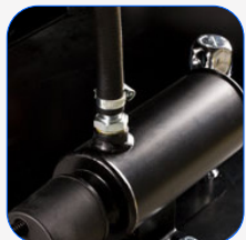
Heizsystem des Motors