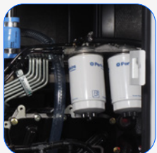
Filtro separador de partículas de combustível