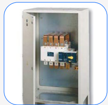
Quadro de comutação motorizada Socomec