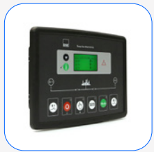
DSE 334 vigilância de rede