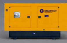
BGBS 220 ST