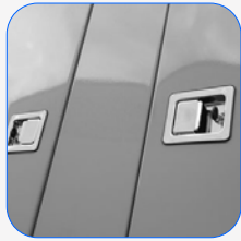
Canópia completa em aço inoxidável (304)