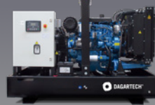
BGB 220 ST