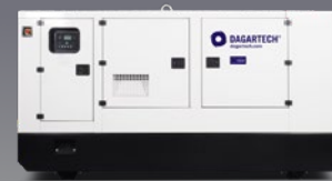
DGJSW 70 ST