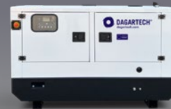
DGPSW 30 ST