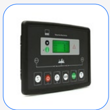
DSE 334 vigilancia de red