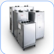
Depósitos externos ROTH DUO SYSTEM