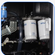
Filtro separador de partículas de combustible