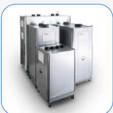
Depósitos externos ROTH DUO SYSTEM