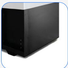
Depósito 24 horas