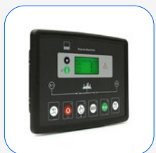
DSE 334 vigilancia de red