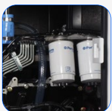
Filtro separador de partículas de combustible