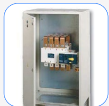
Cuadro de conmutación motorizada Socomec