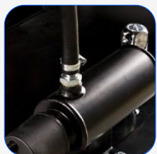
Sistema de caldeo de motor