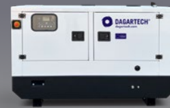
DGPSW 60 ST