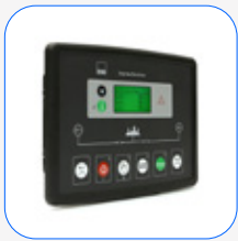
DSE 334 vigilancia de red