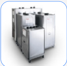
Depósitos externos ROTH DUO SYSTEM