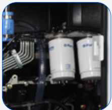
Filtro separador de partículas de combustible