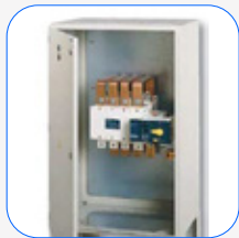
Cuadro de conmutación motorizada Socomec