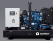
BGB 220 ST