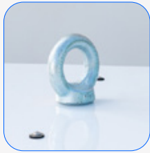
Pértiga de elevación central