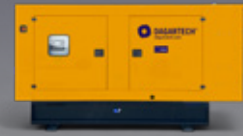
BGBS 220 ST