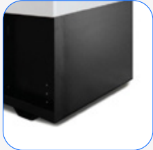
Depósito 24 horas