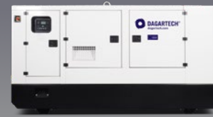
DGJSW 100 ST