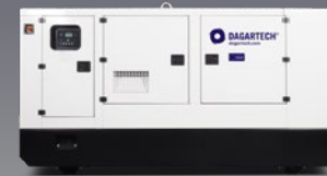
DGPSW 100 ST