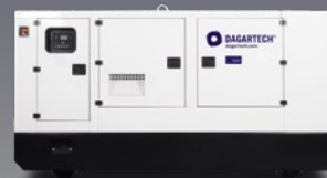
DGVSW 230 ST