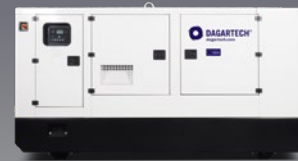
DGVSW 520 ST